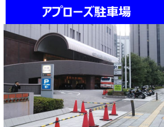
アブローズ駐車場

ホテル阪急 インターナショナル直結 約390台 駐車可 30分毎250円 7~23時営業