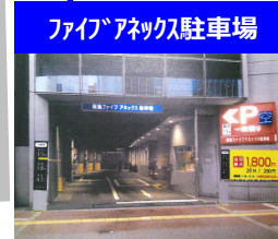
ファイブアネックス駐車場