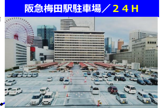
阪急梅田駅駐車場/24H

ホテル阪急 インターナショナル直結 約390台 駐車可 30分毎250円 7~23時営業