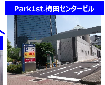
Park1st.梅田センタービル

当日最大1800円 約160台駐車可！ ハイルーフ可(高さ2.0m迄) 30分毎300円、7~24時営業