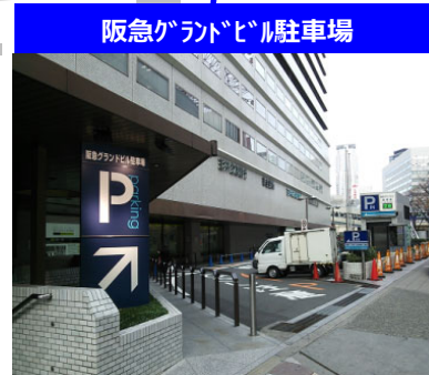
阪急グランドビル駐車場

8-18時:20分毎200円 18-翌2時:30分毎300円 2-8時:1時間毎100円